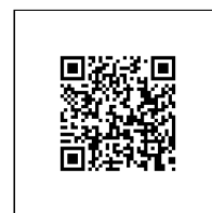
Zažádejte o vytyčení

Přílohy: Detailní zákres plynárenského zařízení